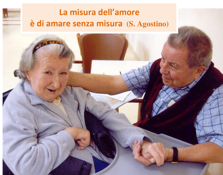
La misura dell'amore è di amare senza misura (S. Agostino)

Renzo e Ada, così uniti anche nei tempi più difficili, ci danno una bella lezione di amore coniugale!